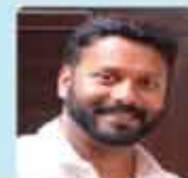
ഗ്രീഫ് കിരക്കരപ്പാട്ട് അംഗീകാരം ലഭിക്കാൻ