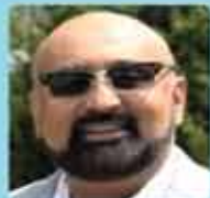
പോൾസൺ കുളങ്ങര വൈസ് പ്രസിഡന്റ്