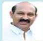
നോൺ ഹാസിൽ സ്റ്റേറ്റ് ഓഫീസ് ഡയറക്ടർ