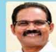
സാമുവ്വ അനന്തേശ്വരൻ പ്രബന്ധ