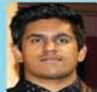
വമുൺ അയർ ജോ.സെക്രട്ടറി