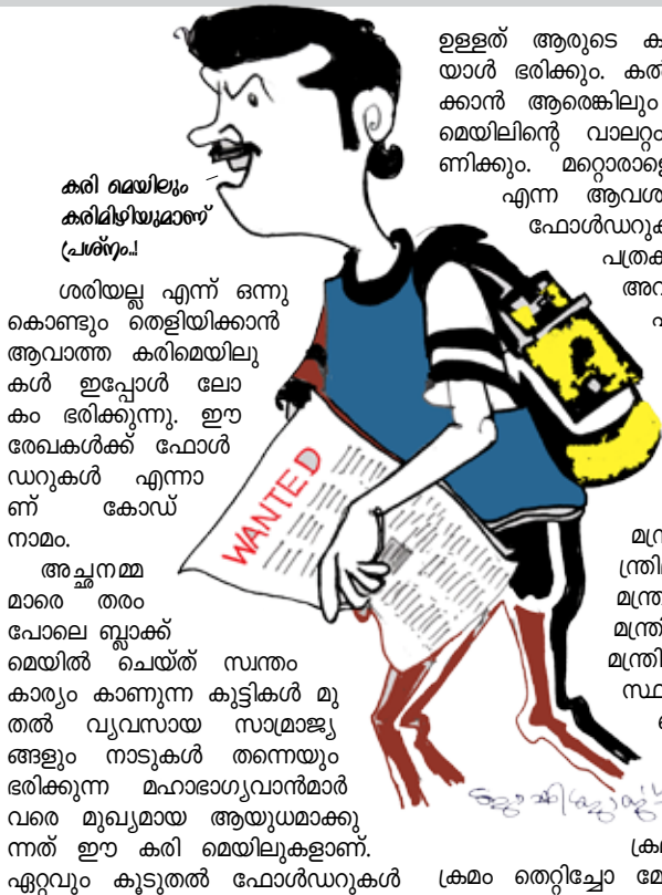
കരി മെയിലും കരിമഴിയുമായ് (പ്രശ്നം)

ചിത്രങ്ങളും ശബ്ദങ്ങളും കൃത്രിമമായി ഉണ്ടാക്കുന്ന വിദ്യ കൂടിയായപ്പോൾ കരിമെയിലിന്റെ സാധ്യതകൾ പിന്നെയും വർദ്ധിച്ചു. നിങ്ങൾ കണ്ടിട്ടേ ഇല്ലാത്ത ഒരാളെ കണ്ടു എന്നല്ല കെട്ടിപ്പിടിച്ചു ഉമ്മവരെ വെച്ചു എന്നു വരെ തെളിയിക്കാൻ വേണ്ട ചിത്രങ്ങൾ കൃത്രിമമായി ഉണ്ടാക്കാൻ പറ്റും!