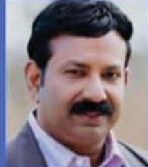
SUNNY KALLOPPARA CULTURAL COMMITTEE CHAIR