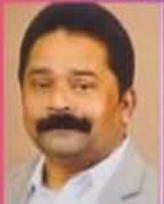
BABY MANAKUNNEL PRESIDENT FOMAA