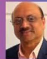
SHOLY KUMPULUVELI FOMAA PRO