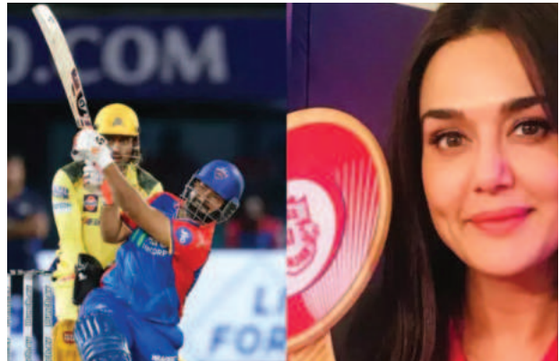
സെറ്റിൽ പഞ്ചാബ് ഉറ്റുനോക്കുന്നത്. കഴിഞ്ഞ ഐപിഎൽ സീസണിൽ ഒപ്പമുണ്ടായിരുന്ന നാല് ക്യാപ്റ്റൻ താരങ്ങളെ ആർട്സിഎം കാർഡ് വഴി ലേലത്തിൽ തിരിച്ച് വാങ്ങാൻ പഞ്ചാബ് കിങ്സിന് സാധിക്കും. അവർ തീർച്ചയായും ഇത് ഉപയോഗിക്കുമെന്ന് പ്രതീക്ഷിക്കുന്നു.

വെക്കാൻ സാധ്യതയുള്ള താരങ്ങൾ ആരൊക്കെയാണെന്ന് നോക്കാം. ഇന്ത്യയുടെ മിന്നും താരങ്ങളായ ഋഷഭ് പന്തും ശ്രേയസ് അയ്യരും അടുത്ത സീസണിൽ പഞ്ചാബ് കിങ്സിനായി ഒരുമിച്ച് കളിക്കുന്നത് തള്ളിക്കളയാനാവില്ല. 2018ൽ ഐപിഎല്ലിൽ ശ്രേയസ് ആദ്യമായി ക്യാപ്റ്റനാകുമ്പോൾ റിക്കി പോണ്ടിംഗിനായിരുന്നു ഡൽഹി ക്യാപ്റ്റൻസിന്റെ പരിശീലകൻ. ഇപ്പോൾ പഞ്ചാബിന്റെ പരിശീലകനായി ചുമതലയേറ്റതോടെ ലേലത്തിൽ ശ്രേയസിനെ വേട്ടയാടാൻ ശ്രമിച്ചാൽ അത്യാവേശമുണ്ടാകും. ഋഷഭ് പന്തിലും പഞ്ചാബ് തീർച്ചയായും കണ്ണുവെക്കും. ഡിസിക്ക്കോപ്പം കഴിഞ്ഞ സീസൺ വരെ പോണ്ടിങ്ങിനൊപ്പം പ്രവർത്തിച്ച താരമാണ് അദ്ദേഹം. പോണ്ടിങ്ങുമായി നല്ല സൗഹൃദം പുലർത്തുന്നതിനാൽ ലേലത്തിൽ ഋഷഭ് പന്തിന് വലിയ വില നൽകാനും പഞ്ചാബ് തയ്യാറായേക്കാം. ലേലത്തിൽ രണ്ട് സെറ്റ് മാർക്കീ താരങ്ങളുണ്ടാകും. രണ്ടിലും പഞ്ചാബ് വളരെ സജീവമാകുമെന്ന് നമുക്ക് പ്രതീക്ഷിക്കാം. 12 കളിക്കാരുടെ മാർക്കീ സെറ്റിൽ നിന്ന് കുറഞ്ഞത് മൂന്ന് നാല് കളിക്കാരെയെങ്കിലും പഞ്ചാബ് വാങ്ങിയേക്കാം. ഇവരിൽ നിന്ന് പുതിയ സീസണിലേക്ക് ഒരു ക്യാപ്റ്റനെയും കണ്ടെത്തേണ്ടിവരും. ഋഷഭ്, ശ്രേയസ് എന്നിവരെ കൂടാതെ ജോസ് ബട്ട്ലറും മിച്ചൽ സ്റ്റാർക്കും മാർക്കീ