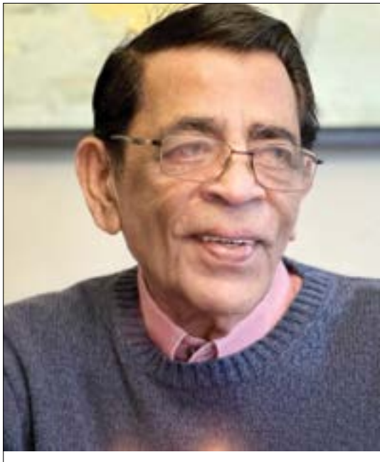
ബോൾ ടീമിലും സജീവമായി.

കോഴിക്കോട് ദേവഗിരിയിലെ സെന്റ് ജോസഫ് കോളേജിൽ ആയിരുന്നു പ്രീഡിഗ്രി. അതേ കോളേജിൽ ബി.എസ്.സി സുവോളജിക്ക് ചേർന്നു. ആദ്യം ഞാൻ സസ്യശാസ്ത്രം തിരഞ്ഞെടുത്തു. അത് പൂർത്തിയാക്കിയില്ല. പക്ഷേ ഒരാഴ്ച ബോട്ടണി ക്ലാസിൽ ഇരുന്ന ശേഷം അദ്ദേഹം രസതന്ത്രത്തിലേക്ക് മാറി. കോളേജ് യൂണിയൻ തിരഞ്ഞെടുപ്പിലും സ്റ്റേജ് ഷോകളിലും കോളേജ് ബോസ്കറ്റ്