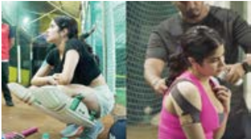
ജാൻവി കപൂർ ഒരു ശസ്ത്രക്രിയയിൽ നിന്ന് രക്ഷപ്പെട്ടത് വെറും തലനാരിഴയുടെ വ്യത്യാസത്തിൽ